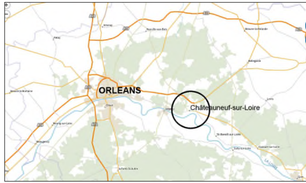
Situation du projet de site classé, à l'est d'Orléans, sur la Loire - JLC