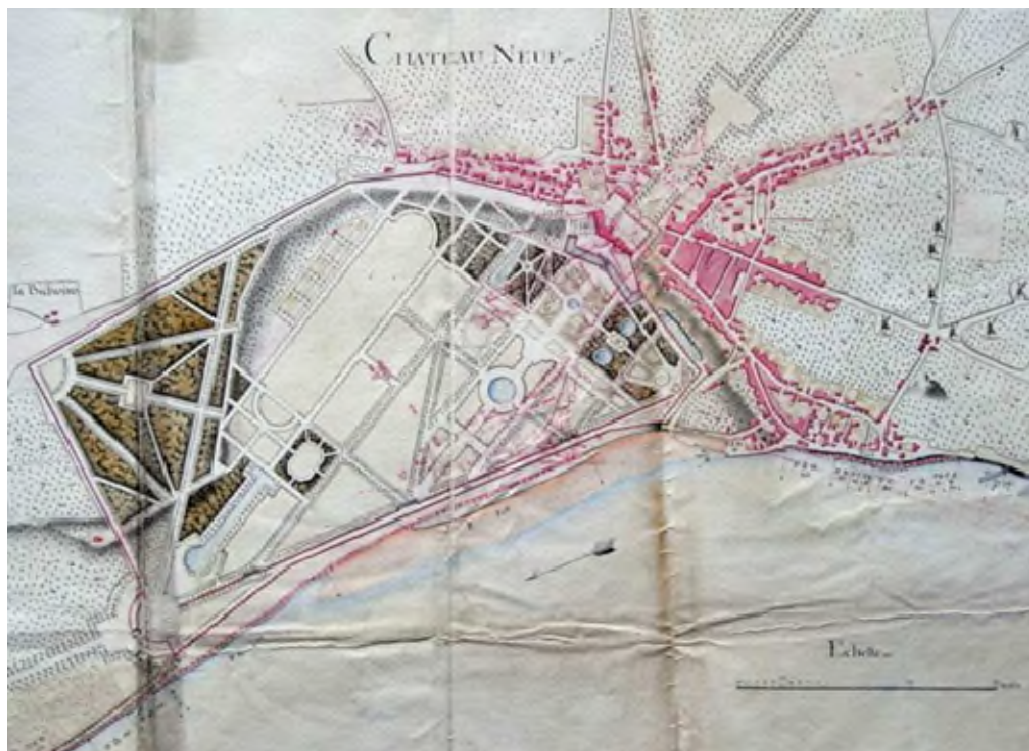
Les jardins du XVII ème siècle - la perspective s'ouvrait sur l'aval de la Loire

L'ancien château féodal a été complètement transformé et agrandi au XVII e siècle. Il a été acquis par la commune en 1926. Le château était situé en haut de coteau, sur une vaste terrasse, et dominait de magnifiques jardins, attribués à Le Nôtre. Cette vaste composition occupait la plaine formée par un ancien méandre du fleuve, et s'articulait avec le château par un jeu d'escaliers et de terrasses plantées. Les jardins, agrémentés de parterres, d'un canal et de bassins, comportaient des perspectives sur le fleuve et étaient protégés des crues par un grand mur d'enceinte construit derrière la levée et qui existe encore.