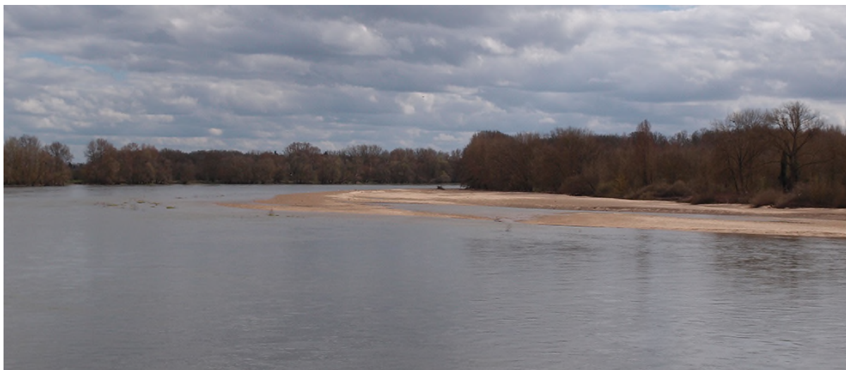
L'amont de la Loire vu de la rive droite

ligériens : la ville qui s'est établie sur le coteau, les quais et le port en bord de Loire, le long pont conduisant au centre du bourg, les grands espaces agricoles et boisés du Val encadrés de levées, et les bancs de sable du fleuve : ces mêmes éléments qui ont justifié l'inscription du Val de Loire au Patrimoine mondial.