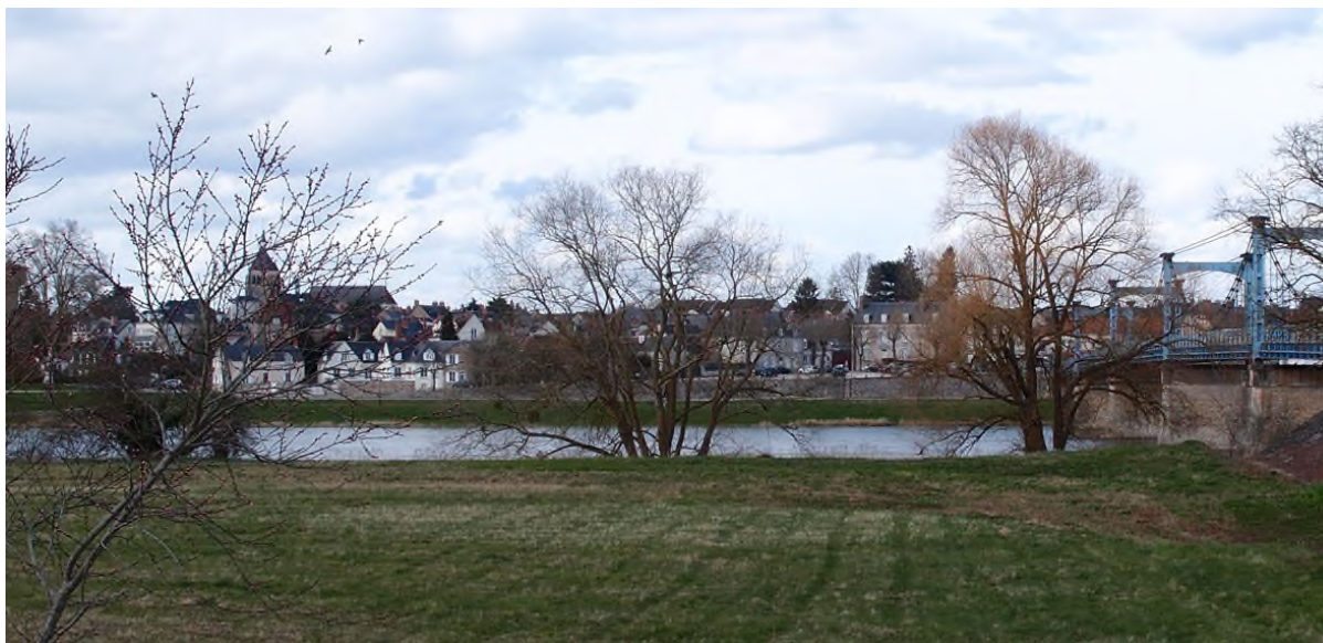
La silhouette urbaine de Châteauneuf depuis la rive gauche, avec le pont suspendu à droite

Située à l'extérieur d'un méandre de la Loire, en rive droite, la cité historique de Châteauneuf-sur-Loire, au débouché du pont suspendu sur le fleuve, offre depuis la rive gauche et le pont une silhouette de maisons basses d'où émerge le clocher de l'église Saint-Martial. Le front bâti sur la Loire est posé sur le long socle des quais maçonnés et du port et encadré à l'amont et à l'aval par de beaux alignements d'arbres dont celui de la promenade du Chastaing.