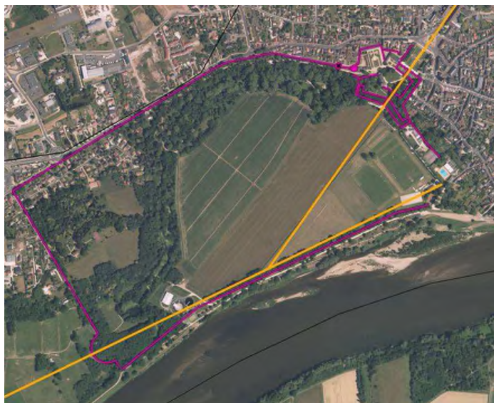
Les traces de l'ancien jardin : axes et périmètre

appartient au département du Loiret, qui l'a acquis en 1933, pour la partie ouest, et en 2004, pour le parc botanique à l'est, et qui le gère aujourd'hui en tant qu'espace naturel sensible. Le reste, la plus grande partie des anciens jardins, en fond de vallée, a disparu au profit de terres agricoles et de terrains de sports. Du château, il ne reste qu'une aile, qui est devenue la mairie, et la terrasse sur laquelle il était bâti. Cette terrasse est entretenue par la ville avec peu de moyens : la cour d'honneur avec ses douves fait office de parking et de square urbain avec quelques beaux arbres relictuels.