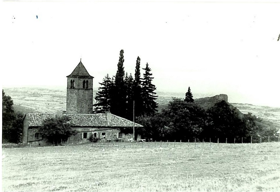
Prieuré de la Grange du Bois, 1941. En arrière-plan la Roche de Solutré - Archives DGALN

Dans les années 80, un constat s'impose : malgré une population en diminution sur les communes de Solutré-Pouilly et de Vergisson, le paysage voit se développer mitage, projets de lotissements peu intégrés, rénovations discutables de bâtiments anciens. Il faut assurer la protection des points forts du site, garantir l'homogénéité du paysage des deux communes et mieux gérer les extensions des villages. Les classements ponctuels existants sont inadaptés et deux nouvelles protections sont créées :