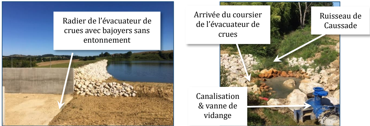
Figure 2 – Quelques images de l'ouvrage réalisé (situation fin mai 2020)