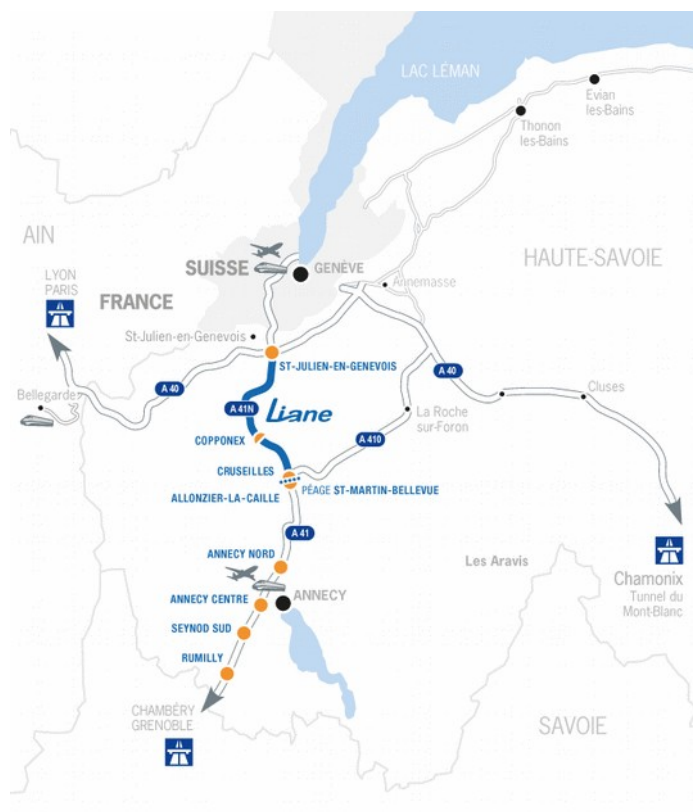
Figure 1 : carte du projet