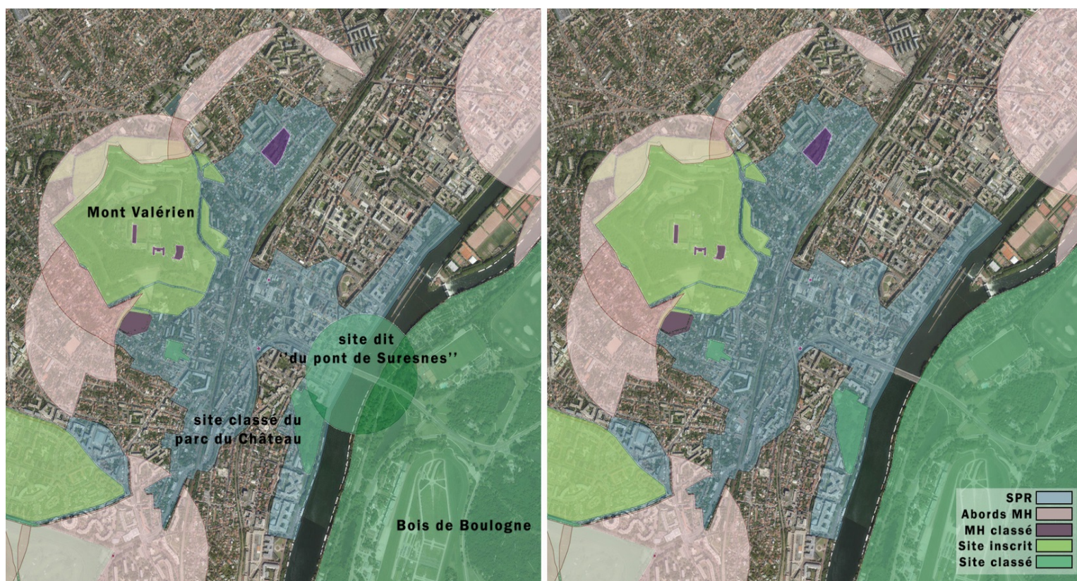
3. Protections de Suresnes, du mont Valérien et du bois de Boulogne, situation actuelle (image de gauche), et situation future (image de droite) avec le déclassement du site "de l'entrée du bois de Boulogne aux abords du pont de Suresnes" (dit "site du pont de Suresnes"). (Atlas des patrimoines – modifications JMB février 2018).

La troisième a été la mise en œuvre d'une zone de protection du patrimoine architectural, urbain et paysager (ZPPAUP) en 1996. Remplacée par une aire de valorisation de l'architecture et du patrimoine (AVAP) – approuvée en février 2014 – elle est automatiquement devenue un site patrimonial remarquable (SPR) depuis publication de la loi n°2016-925 du 7 juillet 2016 relative à la liberté de la création, à l'architecture et au patrimoine.