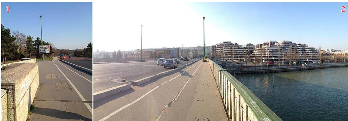
1. L'entrée du bois de Boulogne, site aujourd'hui doublement classé ... et son affichage (1) Le site "du pont de Suresnes" aujourd'hui (2). (photos JMB, avril 2015).

Lors d'une première mission, en avril 2015, pendant laquelle j'avais pu rencontrer les élus, j'avais donné un avis favorable à la poursuite de ce projet de déclassement. En effet, au cours de cette mission je n'avais pu que faire un constat identique à celui de l'inspecteur général des monuments historiques chargé des sites, M. Philippe Siguret, dans son avis, du 11 juin 1986 devant votre commission, à propos du classement du site du parc du château de Suresnes : « ... Les perspectives du bois de Boulogne ayant fait l'objet d'une protection au titre de la loi de 1906 sur les sites [...] selon un cercle de 300 m tracé à partir du centre du pont (arrêté du 11 juillet 1922). Singulière protection dans son énoncé qui n'a été d'aucune portée pratique, à tel point que la partie la plus "massacrée" se trouve au débouché du pont ... ».