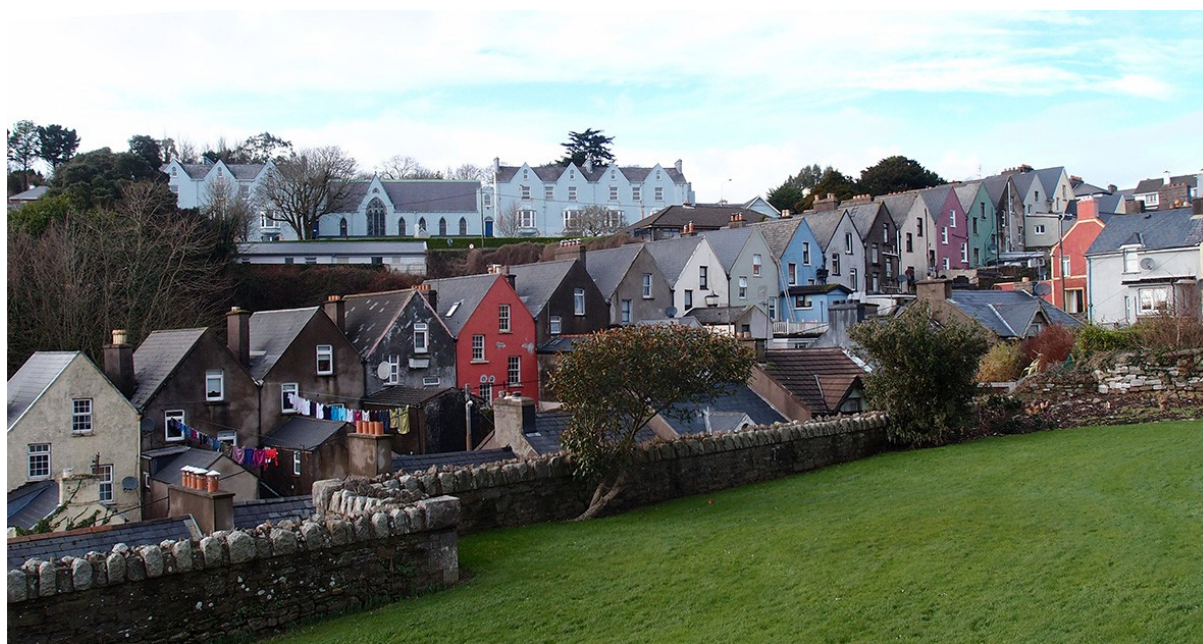
Maisons en bande à Cobh – Irlande

Éléments de parangonnage pour les politiques publiques françaises