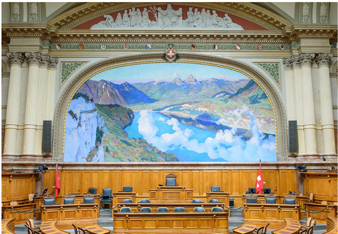
« En Suisse, le paysage est pris en compte à travers toutes les politiques sectorielles et non pas comme une politique à part. » Palais fédéral suisse à Berne – Fresque de Charles Giron représentant le lac des Quatre-Cantons