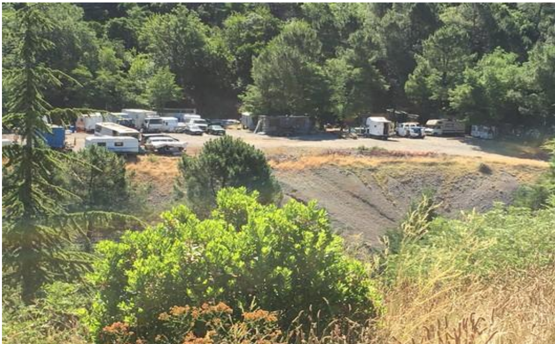
Schéma 4 : Photographie du terril du carreau n°3, propriété du GFA la Gravouillère