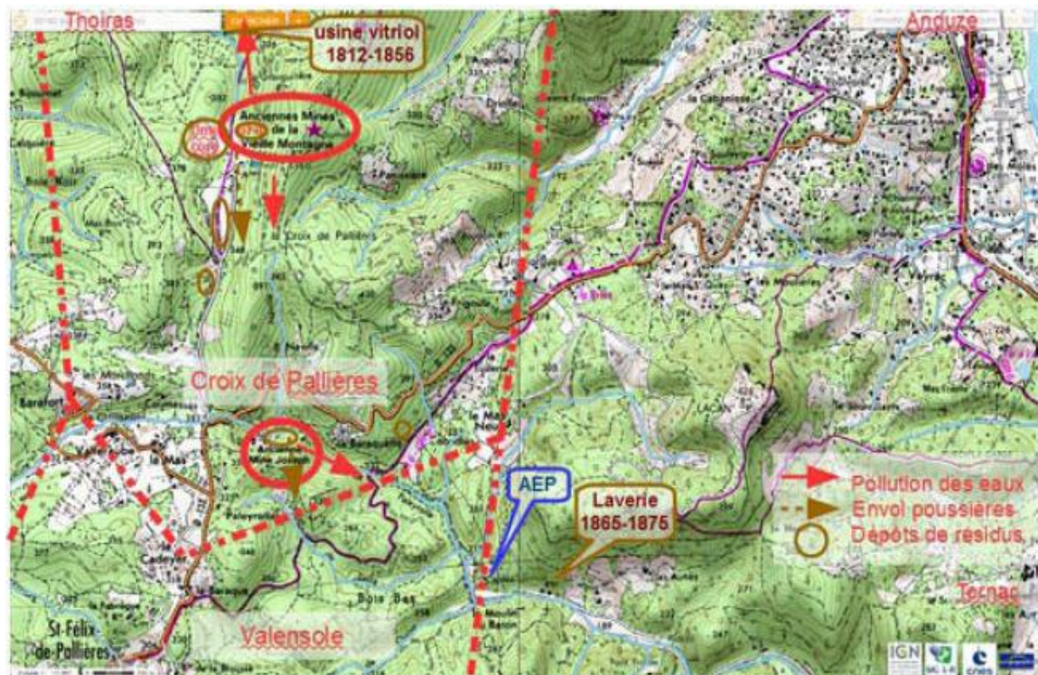
Schéma 2 : Impacts liés à l'ancienne mine de la « Vieille Montagne » et « Joseph »