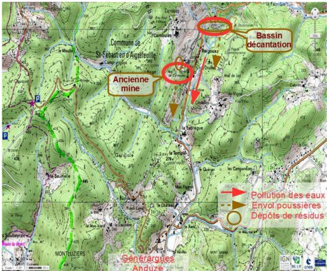
Schéma 5 : Impacts liés à l'ancienne mine de « Carnoulès » à Saint-Sébastien-d'Aigrefeuille