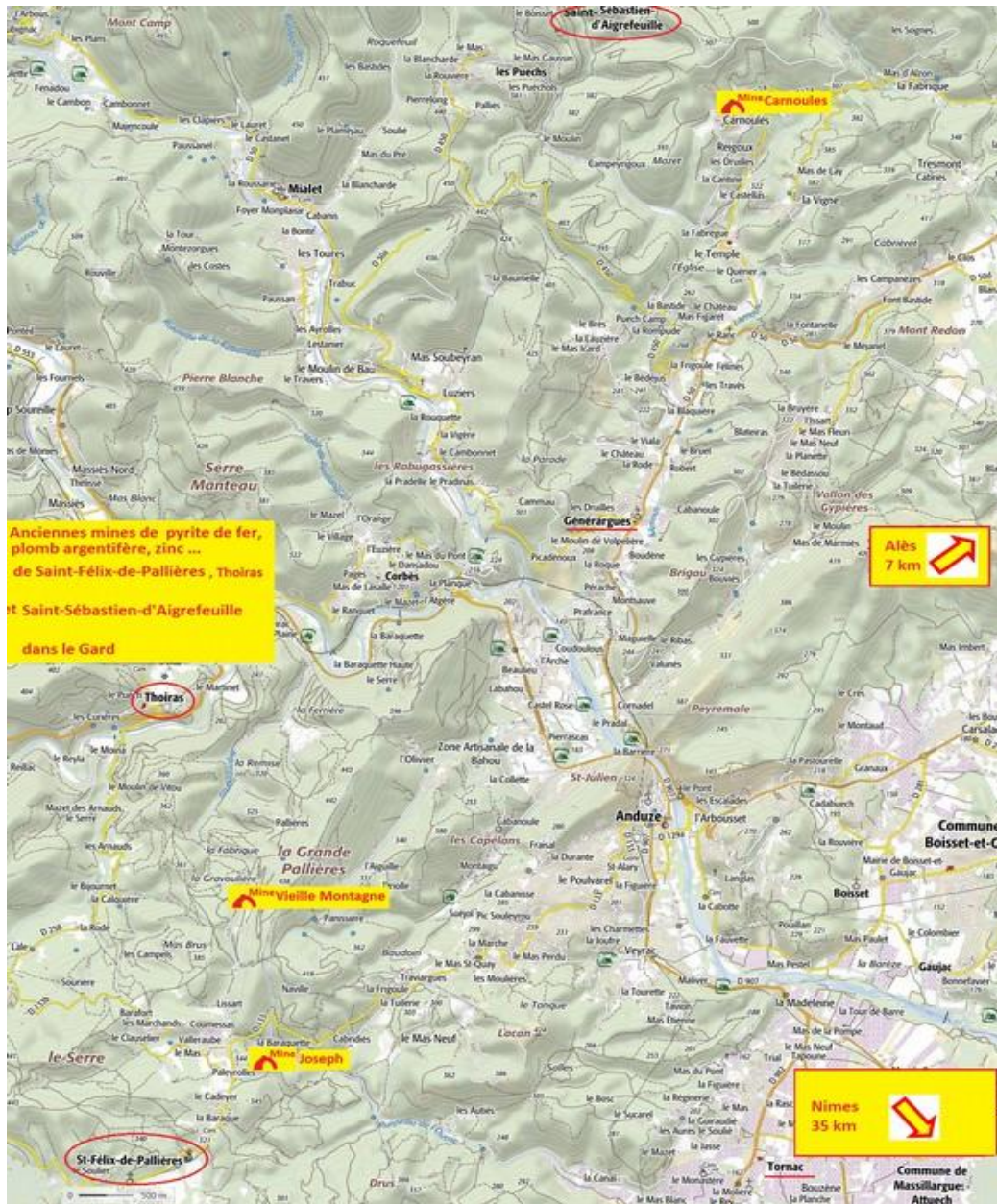
Schéma 1 : Plan de situation