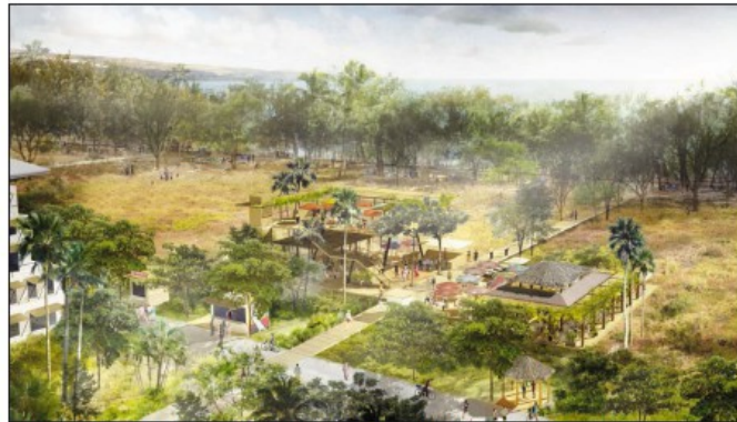
Saint-Paul dans quinze ans ? La plaine aride de Cambaie transformée en poumon vert.

En tête de pont, une société publique locale (une de plus) "souple et spécialisée", présidée par un élu du TCO, qui s'appuie sur un conseil d'administration impliquant tous les partenaires du projet, et un comité stratégique autour des