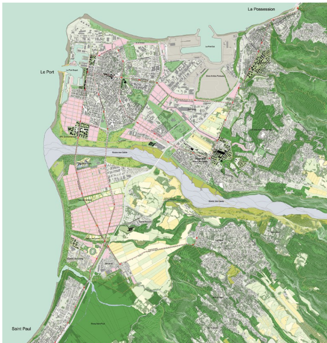
Ateliers Lion associés architectes urbanistes paysagistes | Zone UP Urbanisme | Zone UP Paysage | Artélia Ville et Transport | Jean-Marie Gleizes

La mission a travaillé uniquement à partir des comptes rendus d'entretiens et de quelques documents qui lui ont été remis; elle n'a eu après son retour que peu d'échanges avec le terrain.