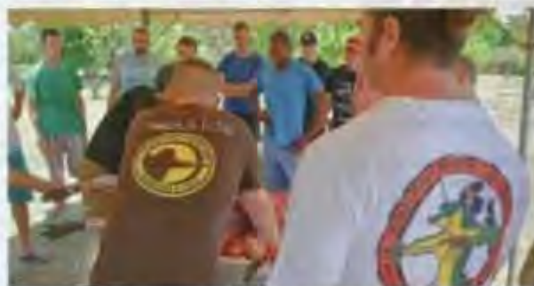
Les chasseurs sont avides de connaissance, aussi bien pour leur sécurité et celle d'autrui, que pour mieux connaître leurs gibiers.

pour ce type de formation qui contribue à améliorer la sécurité à la chasse, le maniement des armes à feu et la prévention des risques en forêt. Les chasseurs ont également reçu des explications concernant les pathologies véhiculées par le gibier et la faune sauvage en général. En raison de l'absence d'une organisation cycloégitique (qui concerne la chasse, ndlr), l'Ascag a établi une convention de partenariat avec la Fédération des chasseurs de l'Aisne qui a détaché, pour l'occasion, un formateur agréé. La cinquantaine de chasseurs présents recevront prochainement leur attestation de chasseur référent venaison et de chasse à l'arc, valable sur l'ensemble du territoire national. ■