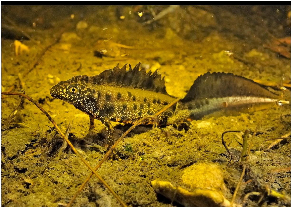
Triton crêté, animal emblématique du bilan environnemental de la ligne LGV Est

5. Le dimensionnement des protections acoustiques devrait, pour les futurs projets d'infrastructure de transport, se référer autant à l'émergence sonore créée par ces projets par rapport au bruit ambiant qu'au respect des normes réglementaires par la valeur moyenne sur les différentes périodes.