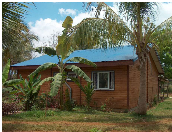
Habitat traditionnel restauré et maison de bois en accession aidée à la propriété sur l'île de Lifou.