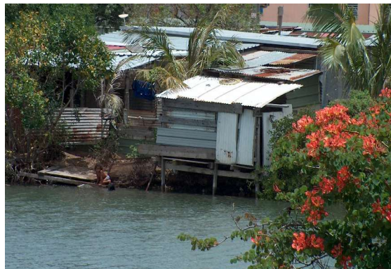
Deux types d'habitat en « squat » à Nouméa

Sur les programmes de logements locatifs aidés en cours de réalisation sur le territoire même de Nouméa (résorption des « squats » dans le val de Magenta par exemple), la mission a pu constater les efforts d'adaptation de l'offre d'habitat à un mode de vie que l'on pourrait qualifier de « transition », proposant de petits immeubles collectifs de 2 à 4 niveaux, bien intégrés dans les mouvements du terrain, et comportant en rez-de-chaussée un petit jardin privatif pour quelques cultures vivrières.