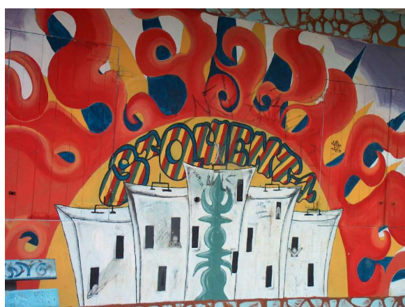
Les tours de Saint-Quentin, et leur représentation sur un mur de l'aire de jeux