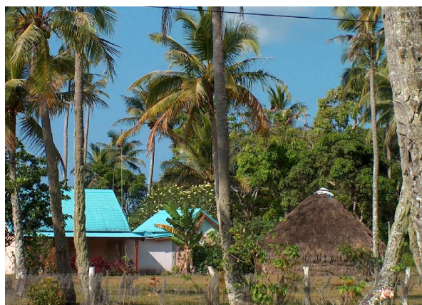
Coexistence habitat ancien et moderne à Lifou