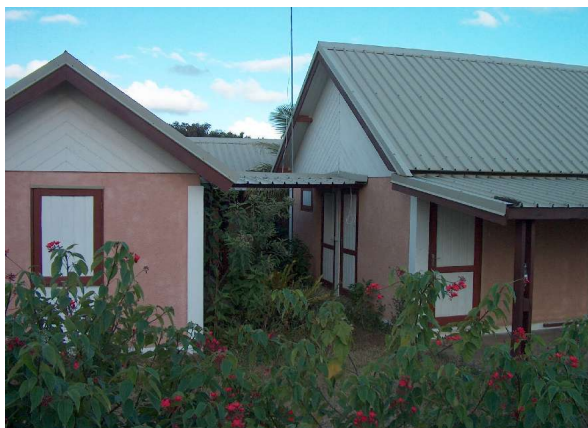
Construction modulaire à Lifou