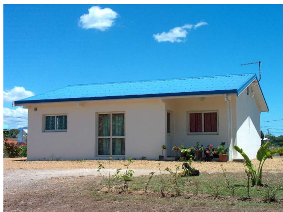
Lotissement près de Koné et maison type en accession aidée à la propriété