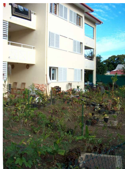
Petit immeuble locatif de la SIC avec jardin en rez-de-chaussée

La conception des logements s'efforce de composer avec le climat, cependant la mission s'étonne du peu d'utilisation de l'énergie solaire, pourtant abondante, pour l'eau chaude sanitaire notamment. Certains logements locatifs neufs visités ne comportent en effet que les tuyauteries pour l'eau chaude sur lesquelles les locataires pourront installer – s'ils le désirent, car l'eau chaude sanitaire n'est pas encore indispensable – un chauffe-eau à gaz ou électrique (solution peu économe pouvant en outre conduire à des « bricolages » peu compatibles avec la sécurité). Ceci est d'autant plus surprenant que, par ailleurs, les logements construits « en défiscalisation » bénéficient d'un taux de défiscalisation majoré de 4 % pour l'utilisation de